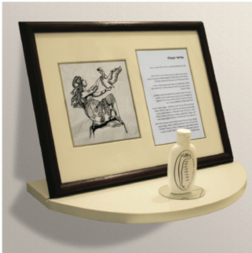
אליסי משחה להסרת שיער גוף מיותר לנשים, הושקה בכרתים ב-1923.